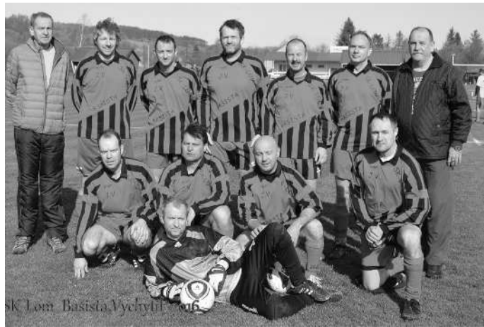
AKTUÁLNÍ LÍDR, mužstvo SK Lom Krnov.